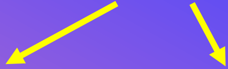
Via Tenuta del Casalotto