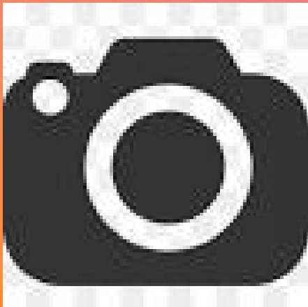
FOTO E VIDEO